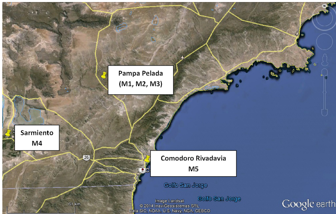
Figura 1 Áreas de estudio.

superficiales de Pampa Pelada, de la zona de chacras de Sarmiento y de suelos de la zona costera en Comodoro Rivadavia (Castro, comunicación personal).